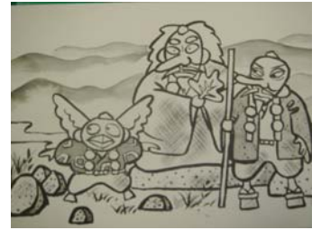
からす天狗の恩返し